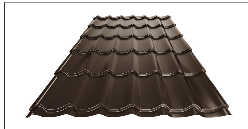
L – OPTIMÁLNÍ DÉLKA KRYTINY PRO MODUL 350 mm