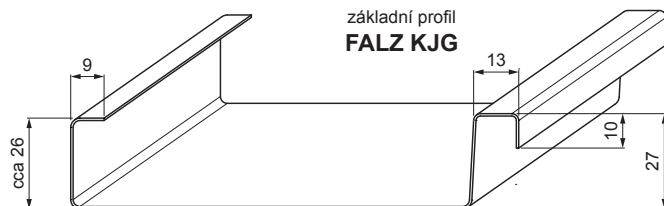
základní profil FALZ KJG