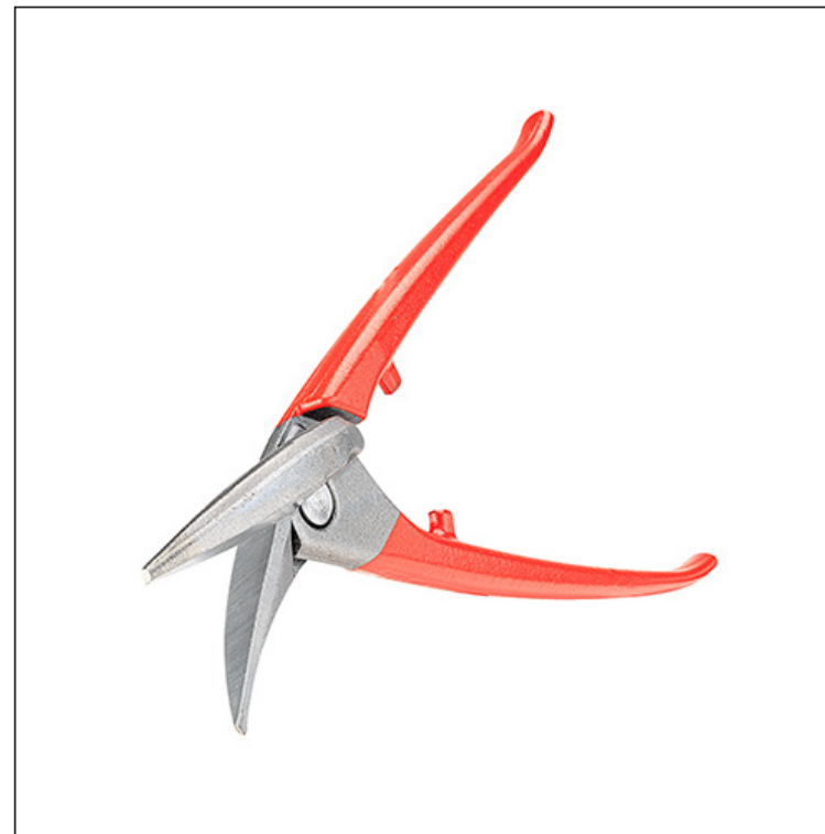
Vysokolegovaná nástrojová ocel