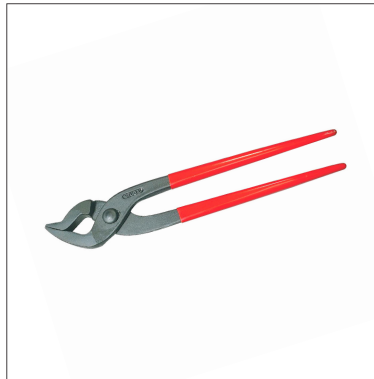
Uhlíková ocel C45