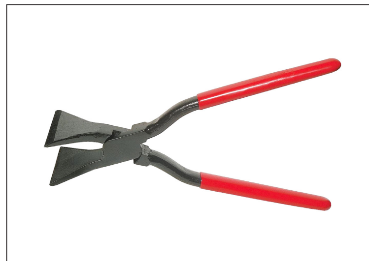
Uhlíková ocel C45