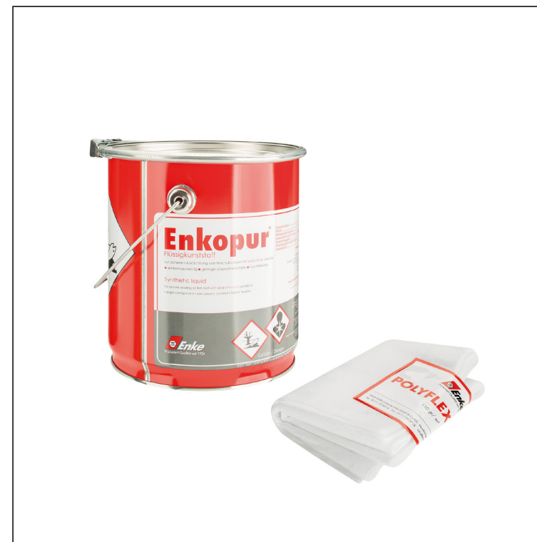
Enkopur : Polyuretanová pryskyřice – Šedá Polyflexvlies: Polyester – Bílá