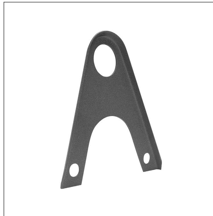
ANM Hliník lakovaný W.15 – Antracit W.15 – RAL 7016