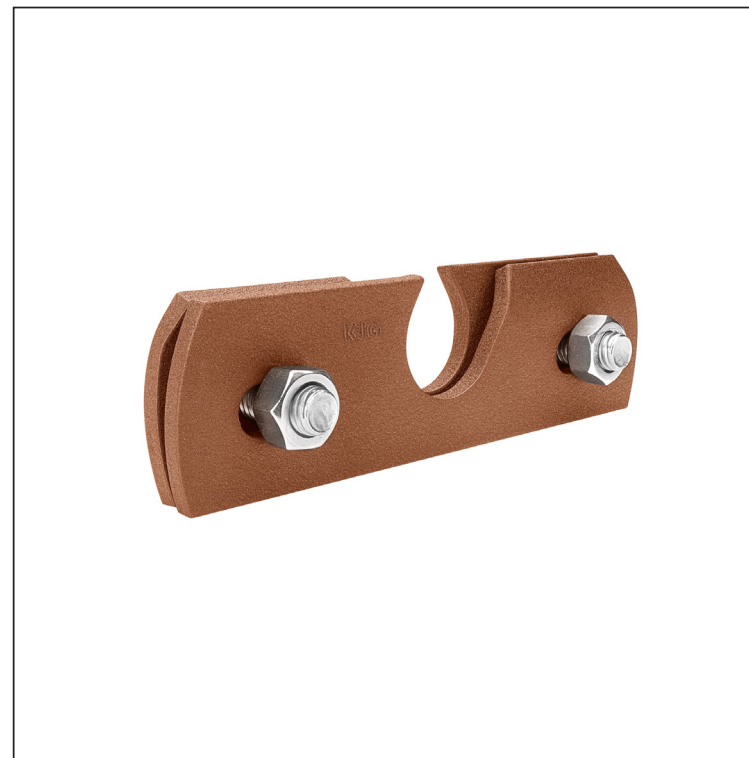
MHM Hliník lakovaný W.15 – Měděno hnědá W.15 – RAL 8004