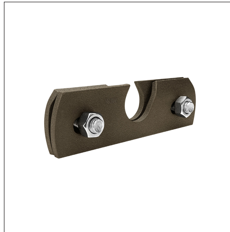
ZHM Hliník lakovaný W.15 – Zeleno hnědá W.15 – RAL 7013