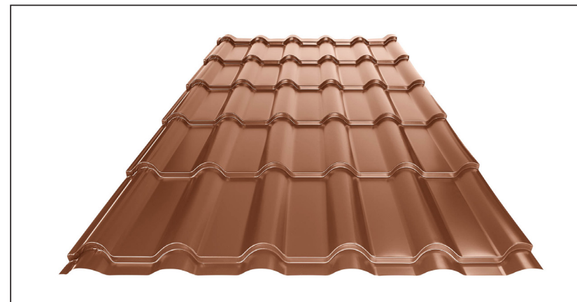
L – OPTIMÁLNÍ DÉLKA KRYTINY PRO MODUL 350 mm