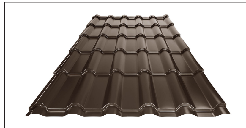
L – OPTIMÁLNÍ DÉLKA KRYTINY PRO MODUL 350 mm