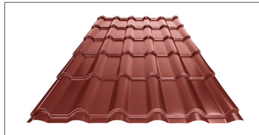
L – OPTIMÁLNÍ DÉLKA KRYTINY PRO MODUL 350 mm