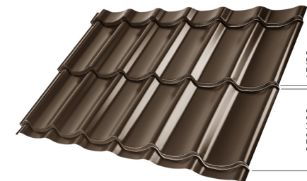
L – OPTIMÁLNÍ DÉLKA KRYTINY PRO MODUL 350 mm