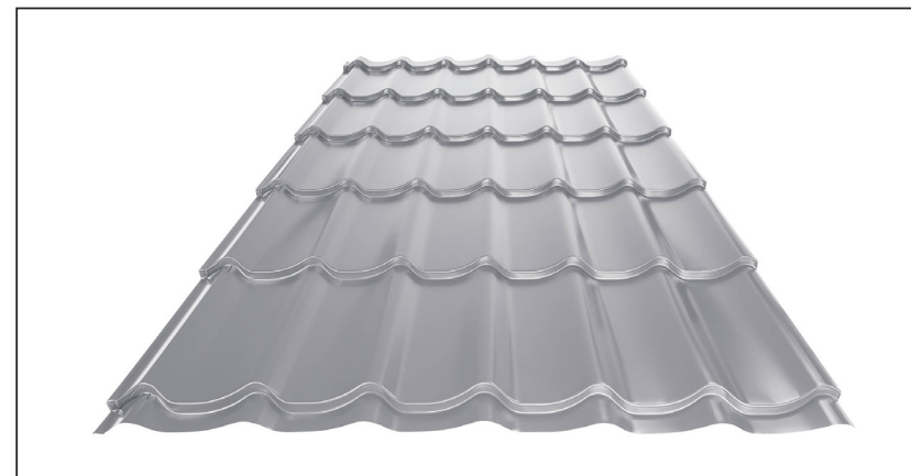
L – OPTIMÁLNÍ DÉLKA KRYTINY PRO MODUL 350 mm