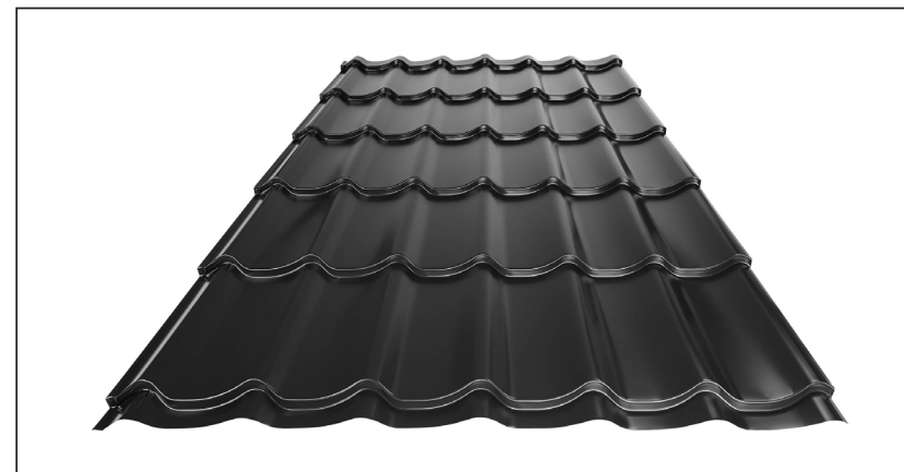
L – OPTIMÁLNÍ DÉLKA KRYTINY PRO MODUL 350 mm