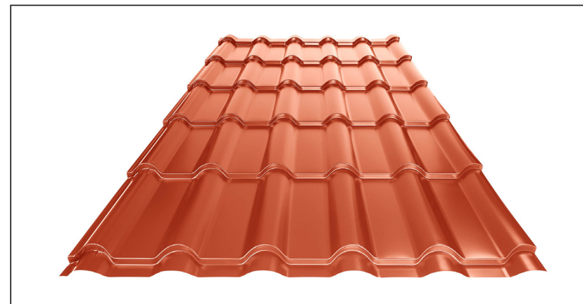
L – OPTIMÁLNÍ DÉLKA KRYTINY PRO MODUL 350 mm