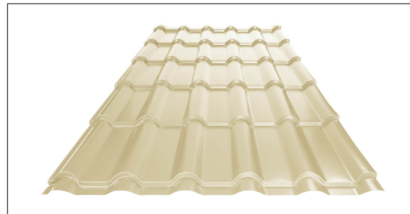
L – OPTIMÁLNÍ DÉLKA KRYTINY PRO MODUL 350 mm