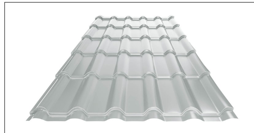
L – OPTIMÁLNÍ DÉLKA KRYTINY PRO MODUL 350 mm