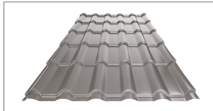
L – OPTIMÁLNÍ DÉLKA KRYTINY PRO MODUL 350 mm