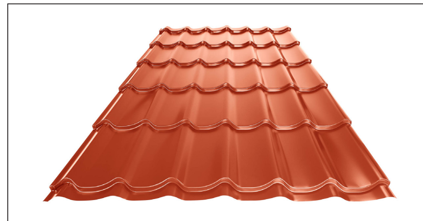
L – OPTIMÁLNÍ DÉLKA KRYTINY PRO MODUL 350 mm