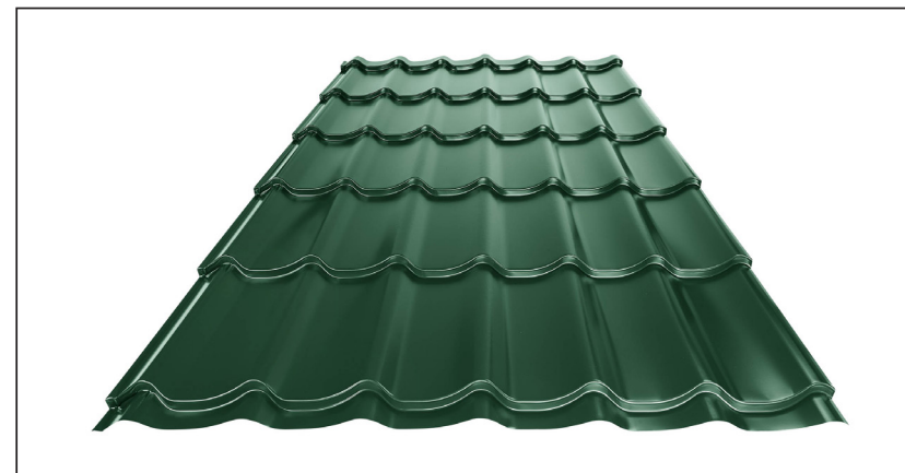
L – OPTIMÁLNÍ DÉLKA KRYTINY PRO MODUL 350 mm