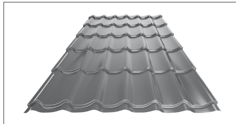
L – OPTIMÁLNÍ DÉLKA KRYTINY PRO MODUL 350 mm